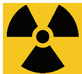
Σχήμα 4 : Διεθνές σύμβολο μολυσματικού και ραδιενεργού χαρακτήρα

Τα κατάλληλα αποθηκευτικά μέσα θα πρέπει να είναι διαθέσιμα στα αντίστοιχα σημεία παραγωγής των αποβλήτων. Ειδικές οδηγίες που αφορούν την κατηγοριοποίηση, διαλογή και πλήρωση των αποθηκευτικών μέσων θα πρέπει να είναι αναρτημένες σε όλα τα σημεία παραγωγής και συλλογής των αποβλήτων.