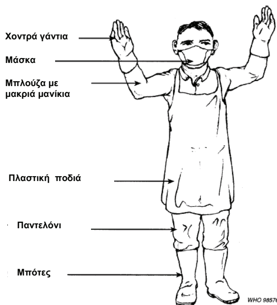
Σχήμα 5: Συνιστώμενη ενδυμασία κατά τη μεταφορά ΕΑΥΜ

Παρακάτω παρουσιάζεται η συνιστώμενη ενδυμασία κατά τη μεταφορά ΕΑΥΜ.